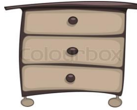
__chest of drawers__