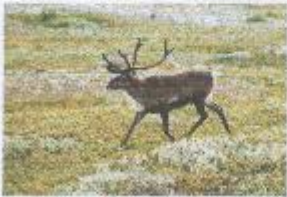
d) POLÁRNÍ PÁS