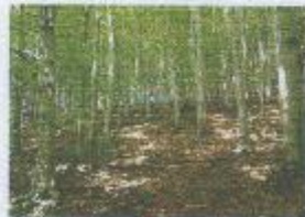
e) MÍRNÝ PÁS