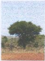
a) TROPICKÝ PÁS