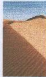
c) TROPICKÝ PÁS