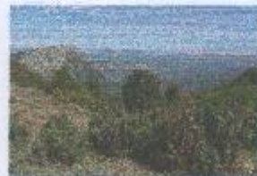
f) POLÁRNÍ PÁS (TUNDRA - PŘECHOD Z MÍRNÉHO PÁSU)